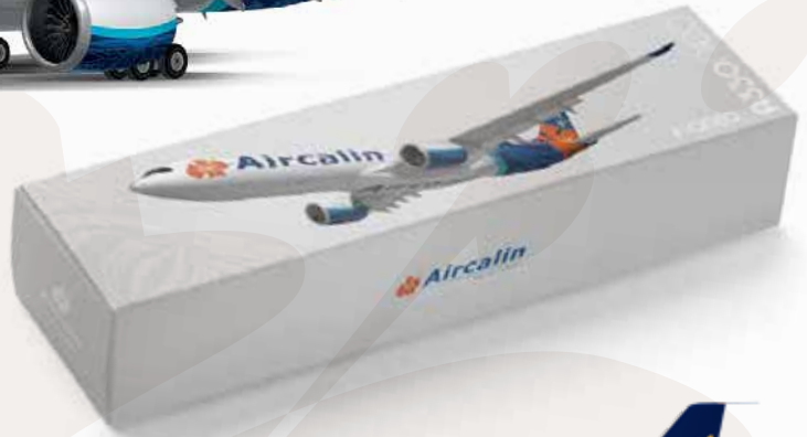
MAQUETTE AIRCALIN A320 NEO 2.000 XPF