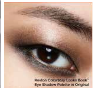
Revlon ColorStay Looks Book™ Eye Shadow Palette in Original