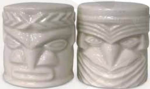
COFFRET SALIÈRE POIVRIÈRE AIRCALIN SALT AND PEPPER SET 1.500 XPF