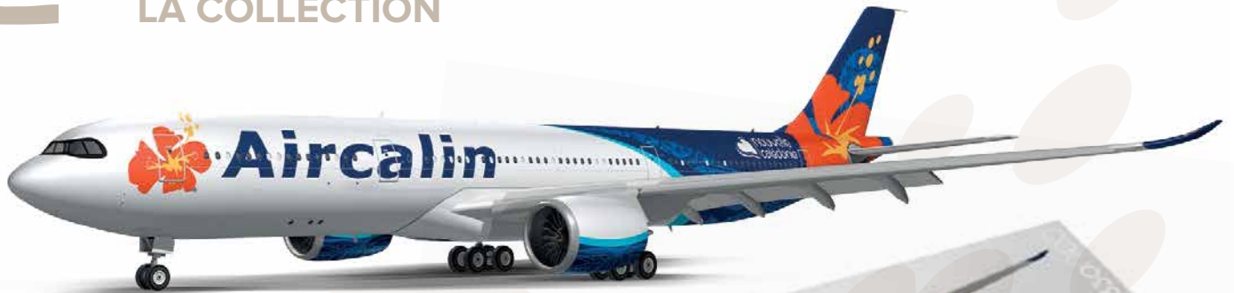
MAQUETTE AIRCALIN A330 NEO 3.000 XPF