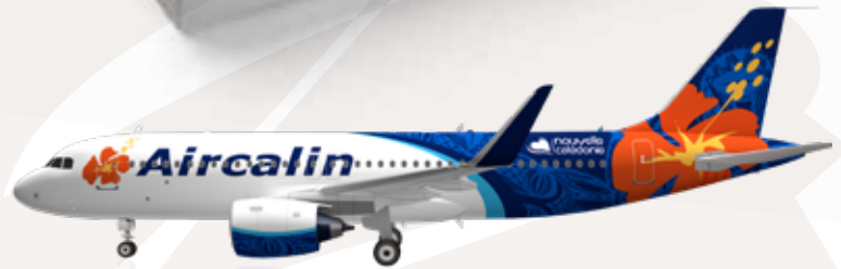
MAQUETTE AIRCALIN A320 NEO « COLLECTOR » 1.000 XPF