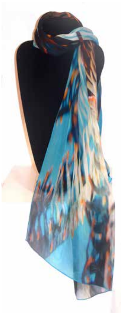
ECHARPE PRESTIGE « FIND ME » STYLISH SCARF « FIND ME »

Les modèles disponibles à bord: The range available onboard includes: